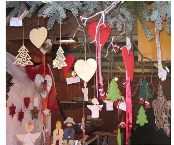
Ein vielfältiges Angebot schmückte den Stand