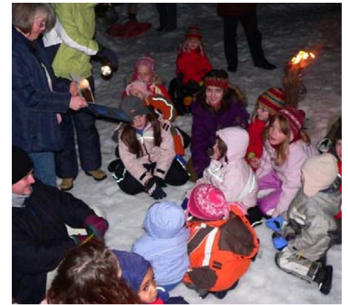
Das gibt's nicht alle Tage: Lagerfeuer-geschichte im Schnee