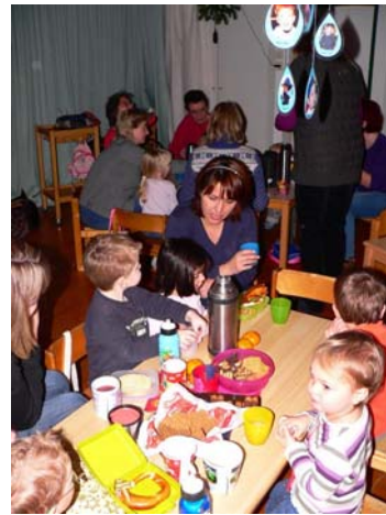
Bei der Vorführung genauso eifrig wie beim Plätzchenessen: Die Kinder des Zwergenkindi

Am Dienstag, den 16. Dezember 2008 herrschte im Zwergenkindi große Aufregung: Die Kinder freuten sich auf die Weihnachtsfeier mit ihren Eltern. Um 10.30 Uhr ging es los mit ein paar Weihnachtsliedern, gesungen von den Kindern. Danach zeigten sie eine kleine Vorführung vom